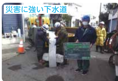
災害に強い下水道

下水道の整備を計画している面積の88%の整備が完了しました。引き続き、着実な整備を進めます。