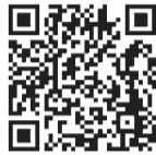
日本年金機構ホームページ▶