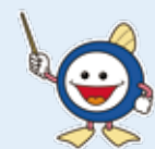
下水道マスコット「スイスイ」

立春から数えて220日(にひやくはつか)に当たる9月10日は、台風が多く下水道の大きな役割である「雨の排除」が重要となるため、「下水道の日」と定められています。