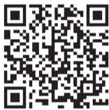
▲予約専用ホームページ