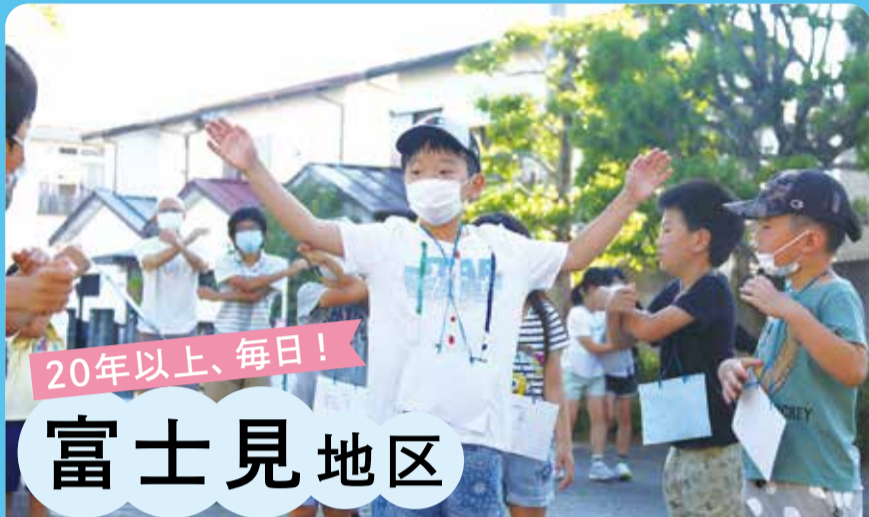
図 地域政策課 ☎ 33-1389 WEB ID P20042

26地区の自治会連合会区域ごとに設立された「地域コミュニティ組織」は、地域課題の解決に向け、さまざまな分野で活動しています。コロナ禍で、地域では多くのイベントの中止や延期が続き、外出や運動の機会が減っています。そんな中、地域に再び“笑顔”と“つながり”をもたらす取り組みとして、おなじみの「ラジオ体操」があります。