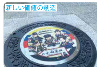
新しい価値の創造

浸水被害のリスクを軽減させるため、広範囲の雨水を集める雨水渠幹線の整備を計画的に進めています。