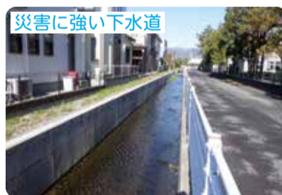
災害に強い下水道

広域避難所周辺などの重要な管渠を耐震化しています。また、計画的な点検や清掃など、適正な維持管理を行います。