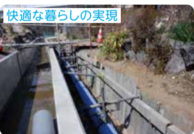
快適な暮らしの実現

令和4年6月に改定した「おだわら下水道ビジョン」では、下水道が果たすべき役割や目指すべき方向性、課題解決に向けた施策を掲げています。 WEBID P09152