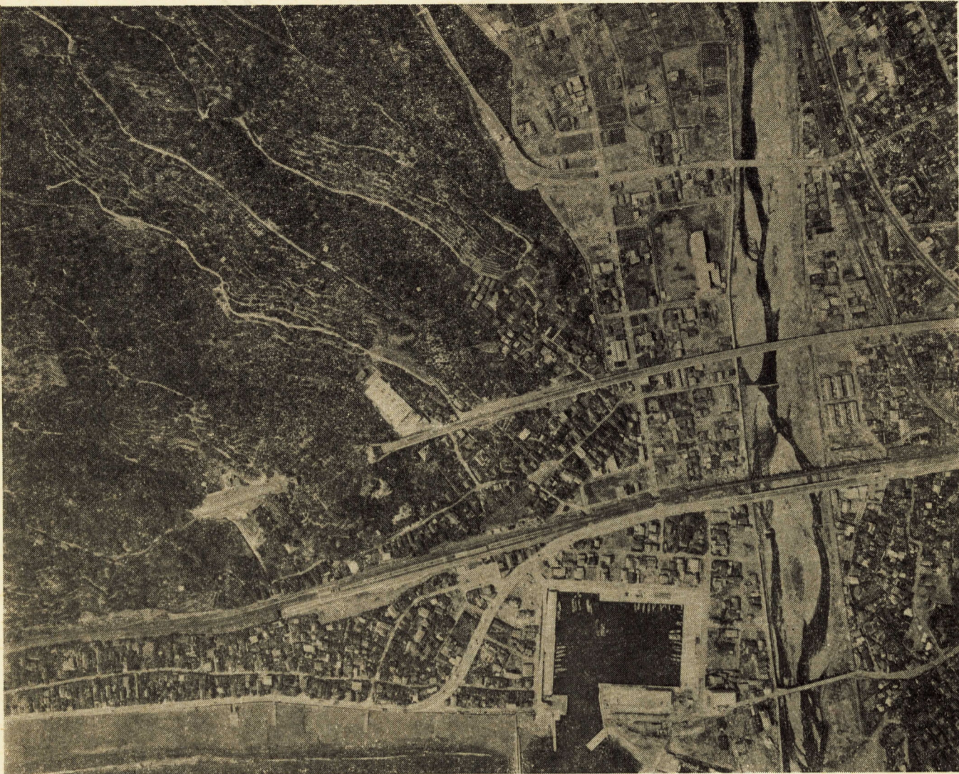
土地区画整理によつて宅地造成された早川右岸地域