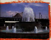
噴水や滝などがあふれる公共的な施設(鶴宮駅前口)