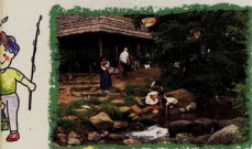
水と緑のオープンスペースがあるレクリエーションゾーン(いこいの森)