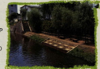
きれいな川や湖で遊ぶ場所（鬼柳排水路）