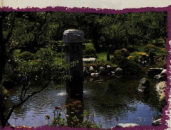
公園や広場に池や噴水があり水に親しめる場所(辻村噴水公園)