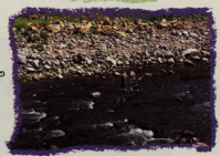
身近な河川や水路などの水辺空間（早川）