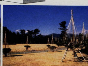
石塚山一夜城歴史公園