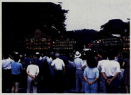
城下町小田原夏まつり (平成2年7月29日) ～自治会山車のパレード 市内の山車17台が一堂に