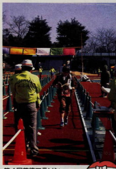
第4回専徳マラソン ～ユニークな参加者も～ (平成3年3月3日)