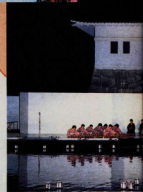
小田原箏伝統音楽の夕