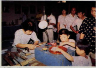
全国伝統工芸品展 おだわら・かながわ名産品大即売会 ～匠の技にふれました。(平成2年7月22日～8月5日)