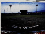
上府中公園・小田原球場