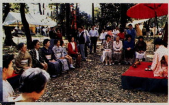
大瀬一夜城跡大宴会 (平成2年4月29日～5月6日)