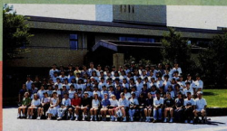
オーストラリア・中国・タイの青少年を招き交流を深めました