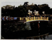
小田原城跡往古橋