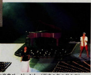
音と光のページェント (平成2年8月5日)