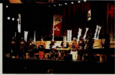
戦国関東三国志 (平成2年5月3日～6日) ～小田原市・甲府市・上越市3市と都市間交流