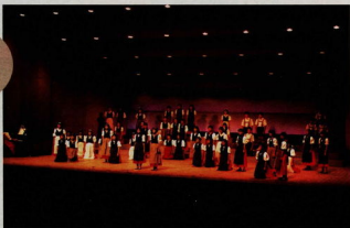
TEPCO小田原音楽祭 (平成2年10月7日/11月4日)