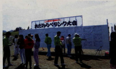
おたわらベタंक大会 (平成2年10月10日)