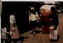
どこでも人気者の「梅丸」