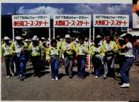
石理山ウォークラリー大会 (平成2年6月17日)