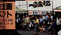
小田原城下今昔市 ・楽市湯屋 (平成2年5月12日～13日)