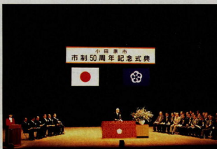
小田原市が50歳になりました。(平成2年12月20日)