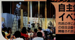
小さな美術館&かまぼこ博物館 (平成2年5月31日～6月6日)