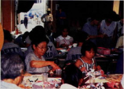
Betty World 90 子供フェスティバル (平成2年8月10日～21日) ～世代をこえて楽しい交流