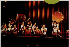
小田原北條太鼓初披露 (平成2年4月28日) ～勇壮にオープニングを祝いました。

KANSAI FASHION SPECTACLE WAOH!! KANSAI FASHION SPECTACLE ～天守閣を仰いでビッグ・イベント (平成2年5月13日)