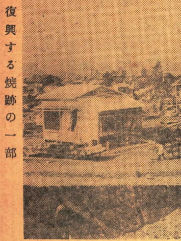
復興する焼跡の一部