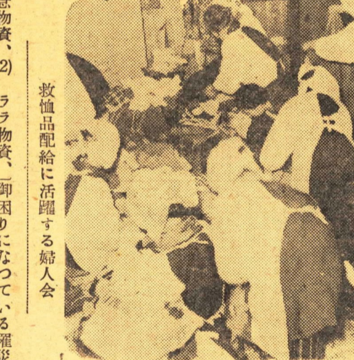
救恤品配給に活躍する婦人会