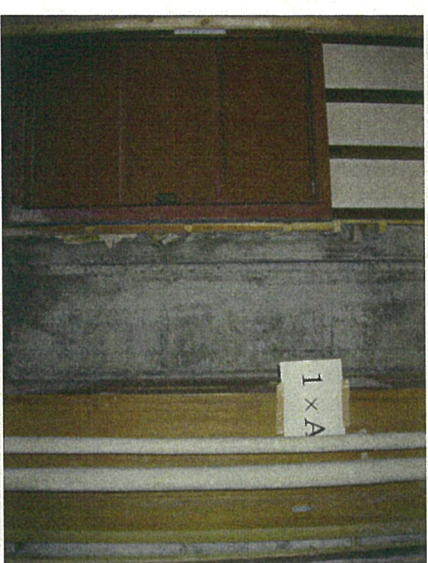
③コンクリートハツリ完了