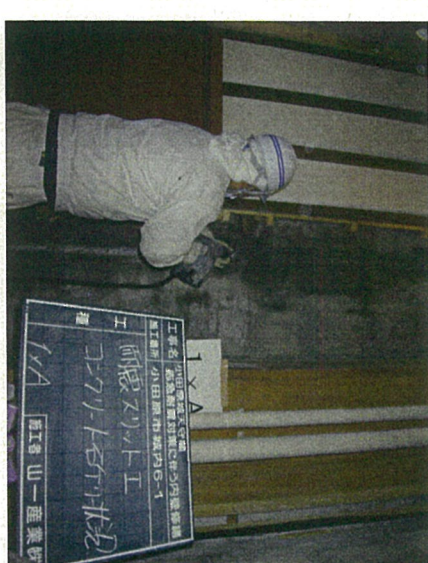
②コンクリートハツリ状況