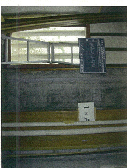
⑥耐震スリット完了