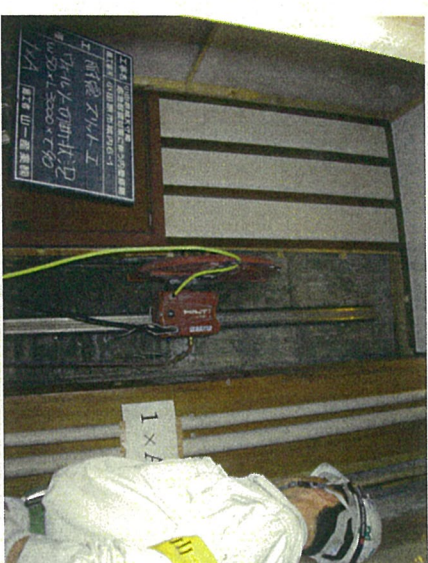
①ウオールスルー切断状況