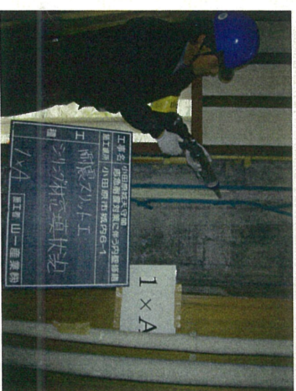
⑤シーリング材充填状況