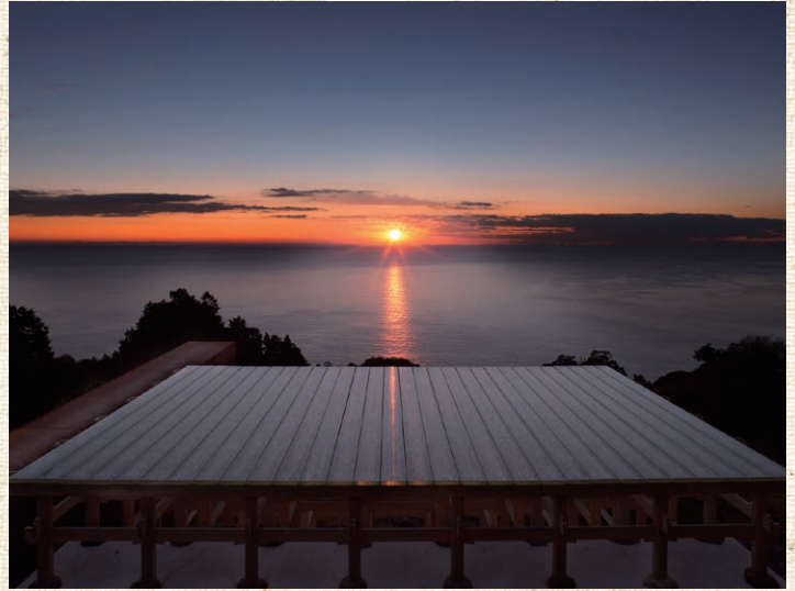
冬至光透拜庭道和光學玻璃舞臺 江之浦氣象觀測所 HP= www.odawara-af.com/en/enoura/