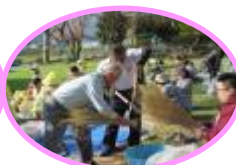
西栢山自治会の方々