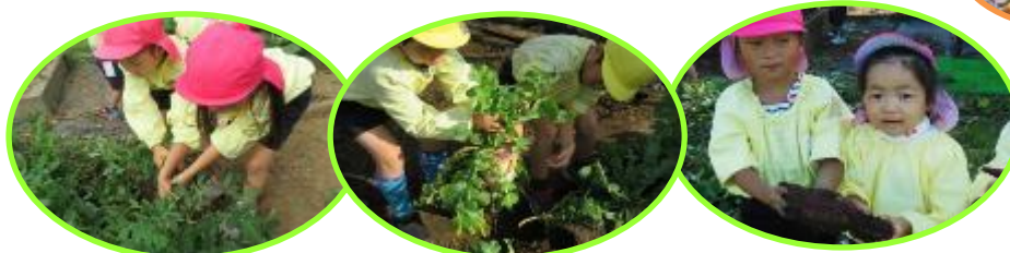
<落花生の収穫> <ダイコンの収穫> <サツマイモの収穫>