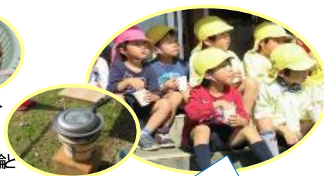
<七輪とフライパン>