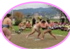
相撲部の方の取り組み