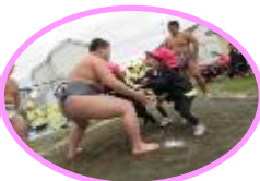
相撲部のお兄さんと年少児の取り組み