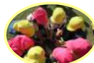
年長・年少ペアになってサツマイモを洗いました