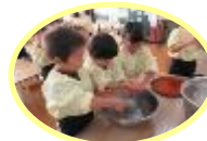
サツマイモをアルミホイルで巻きました