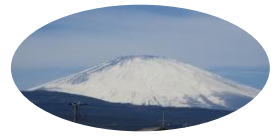
幼稚園から見える富士山

寒かった冬から、ぽかぽか陽気の暖かい日が続いています。登園時につくしを持ってきて見せてくれる子ども達です。朝の挨拶をしながら子ども達の名前を呼んでいると、ほっとした気持ちになってきます。一年間、二年間、朝の挨拶の一時は気持ちのいい一日の始まりでした。