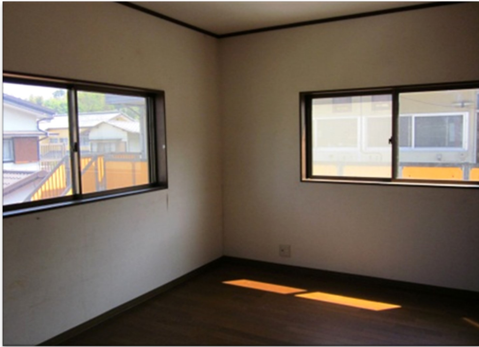
日当たり良好な2階