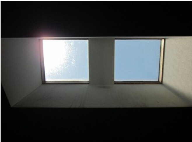
天窗から明るい陽射しが射し込みます！