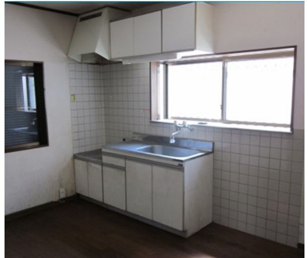
1階のダイニングキッチン

田舎の田園風景の中にありますが、日常生活を徒歩で過ごすことのできる立地です。築29年の貸家なので、少し古い感じは受けますが、田舎の雰囲気にはマッチしているのではないのでしょうか。