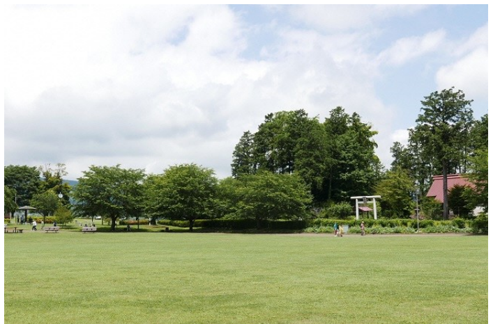
諏訪の原公園の様子