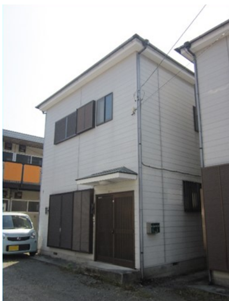
東側から見た外観

歩いて20分弱の距離にある県立諏訪の原公園は、里山の自然や地域文化とふれあいながら、散策やレクリエーションなどが楽しめる公園です。丹沢の山並みを背景に足柄平野が一望できる展望広場や、県立都市公園では最長の169メートルのローラー滑り台、開放感あふれる芝生の多目的広場、ミカンなどを栽培するふるさと果樹園など家族で楽しめる公園となっています。この公園は今後も整備が進む予定で、更に楽しめる公園となることに期待できます。