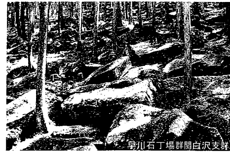
早川石丁場群関白沢支群