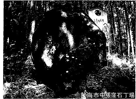
熱海市中張窪石丁場