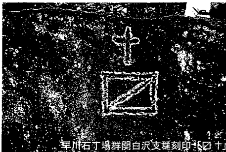
早川石丁場群関白沢支群刻印「田」