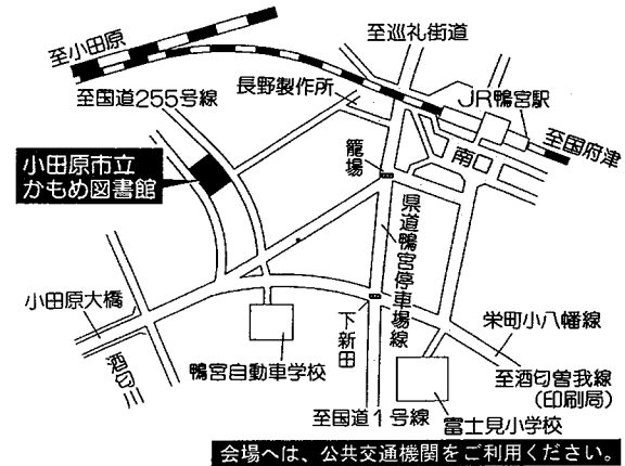
会場へは、公共交通機関をご利用ください。