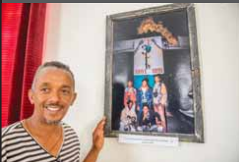
2016年5月 アスマラでのSense of Freedom展にて