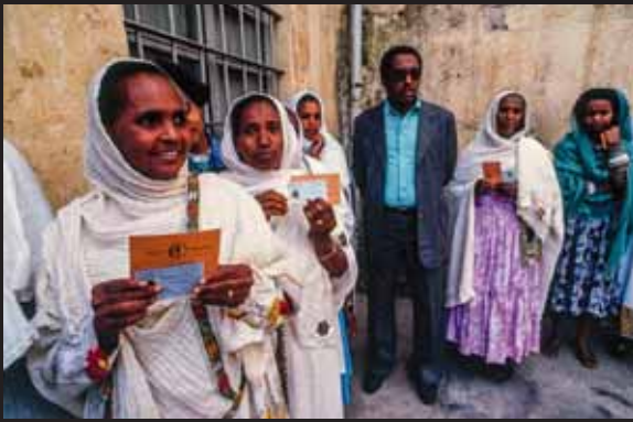
国民投票に列をなす人々 1993年4月 アスマラ