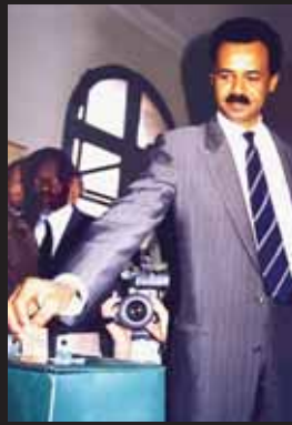
国民投票に票を投じるイサイアス大統領 1993年4月23日 アスマラ