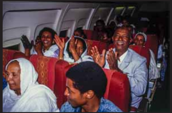
アスマラへ到着し喜ぶ乗客たち 1991年