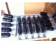
ペットボトル太陽熱温水器 づくりWS