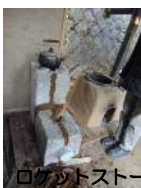
ログカブトストーブ