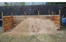
コンポストボックス