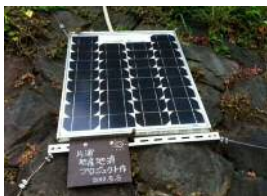
太陽光パネルづくりWS