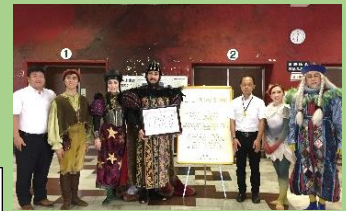
写真は贈呈式の様子