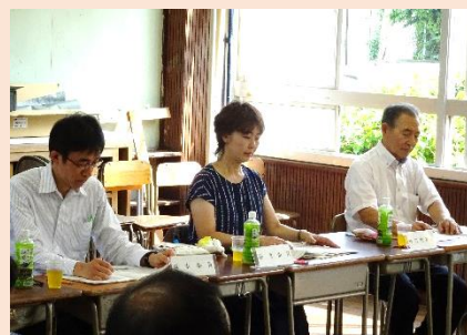
←様子③ 教育長と 教育委員

こうした意見を活用することで、実施している事業を見直し、よりよい事業となるよう努めています。