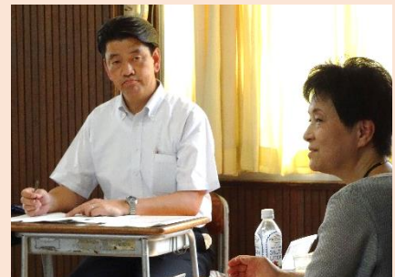
様子②→ 市長と 教育委員

小田原市では、これまで教育予算の考え方や学校施設整備、地域コミュニティなどをテーマに、毎年2〜3回開催しています。