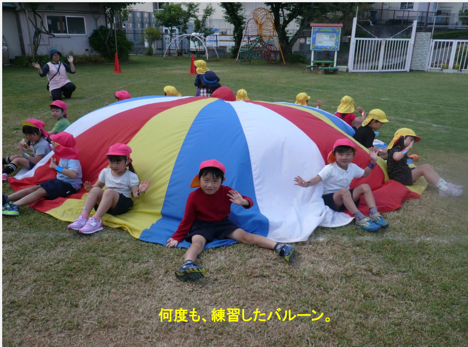
何度も、練習したバルーン。