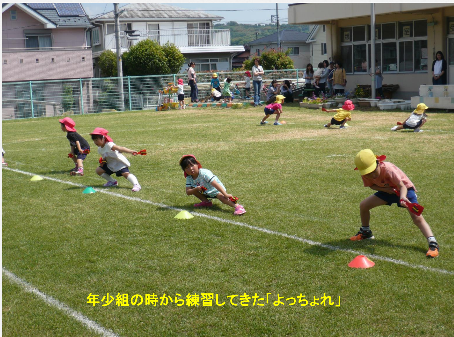
年少組の時から練習してきた「よっちょれ」