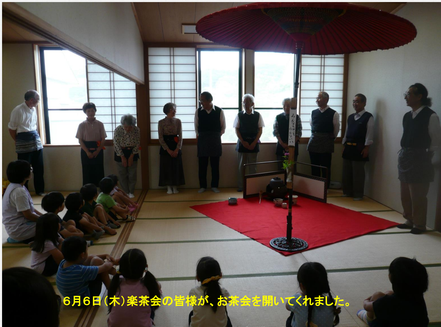
6月6日(木)楽茶会の皆様が、お茶会を開いてくれました。