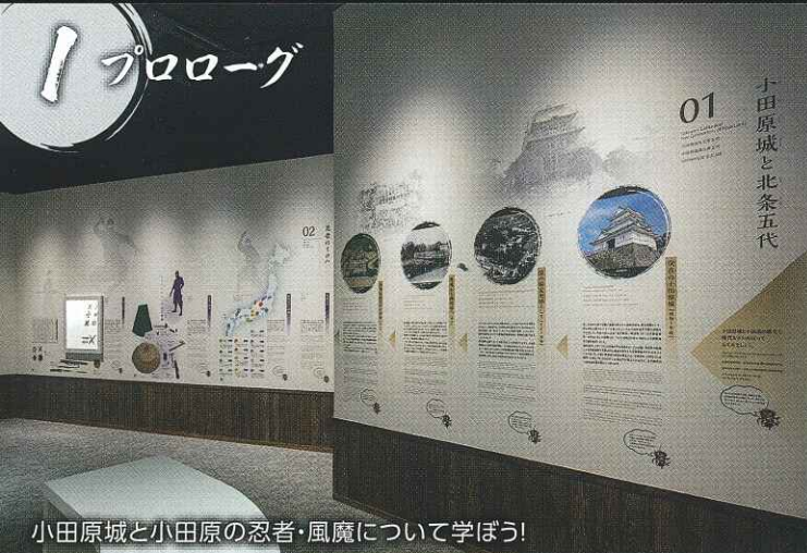
小田原城と小田原の忍者・風魔について学ぼう!