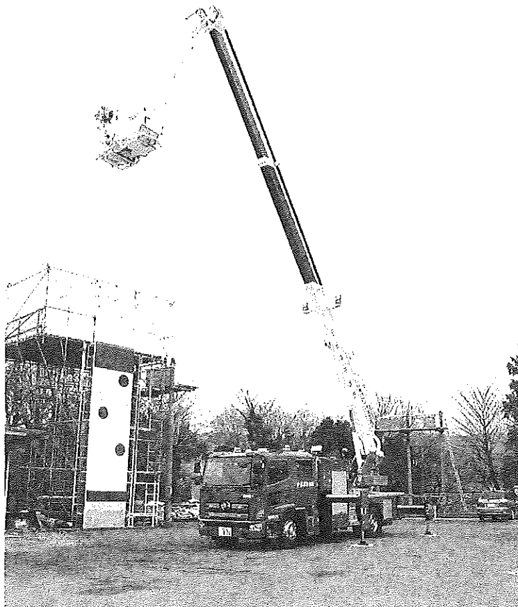
屈折はしご自動車（足柄梯子1）