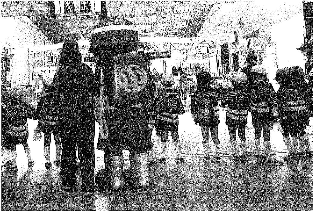
平成30年度小田原市幼年消防クラブ駅頭広報