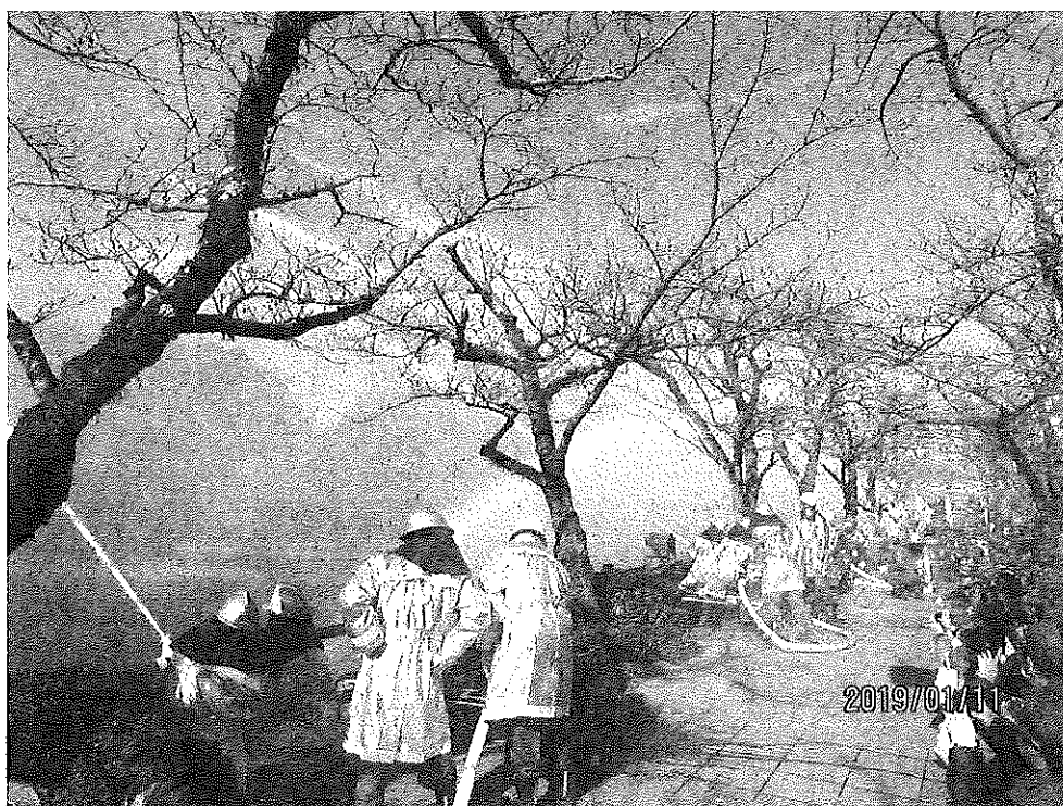
消防出初式一斉放水