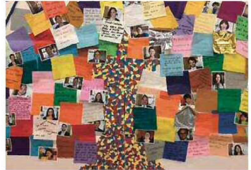
作成したアート作品「希望の木」