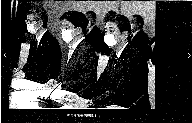
発言する安倍総理 1