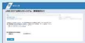
LINEコロナお知らせシステム 登録フォーム