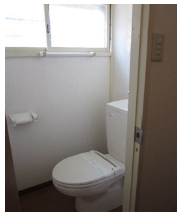
風呂・トイレも新しく綺麗

駅からの距離は少しありますが、駐車場完備でショッピングモールが至近と、普段の生活には不自由しない物件です。洋室タイプの部屋で、リフォーム済みの綺麗な内装なので、住居としての利用はもちろんですが、リモートワークの職場としての利用もおすすめです。