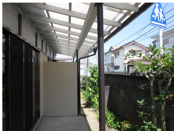
西側から見た外観と南側にある縁側