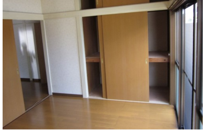
南向きなので明るく、リフォーム済なので綺麗です