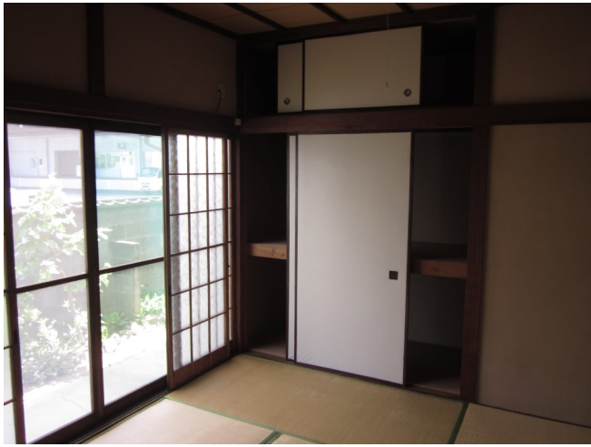
南向きで明るい和室