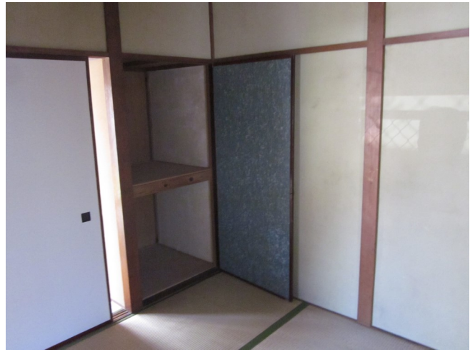
押入れの収納スペースも十分です