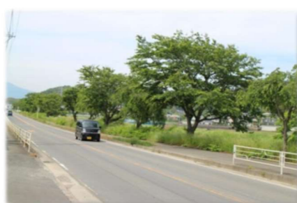
県道 709 号(中井羽根尾)沿いの街路樹