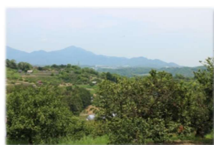
千代の松跡から望む丘陵の農地景観