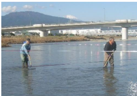
産卵場所を増やす活動