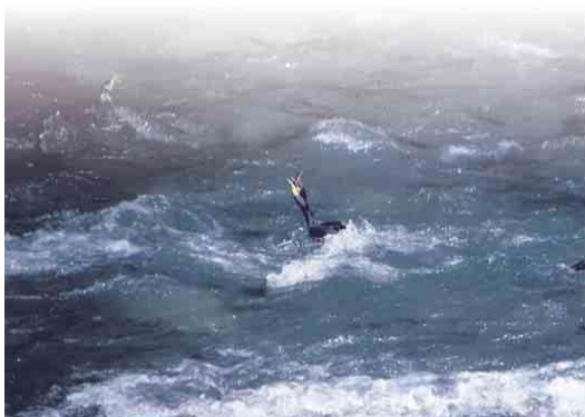
アユを食べるカワウ

組合員の方々は、カワウに食べられないように、音を出して追い払いをしたり、最近はドローンを使って追い払いをしています。