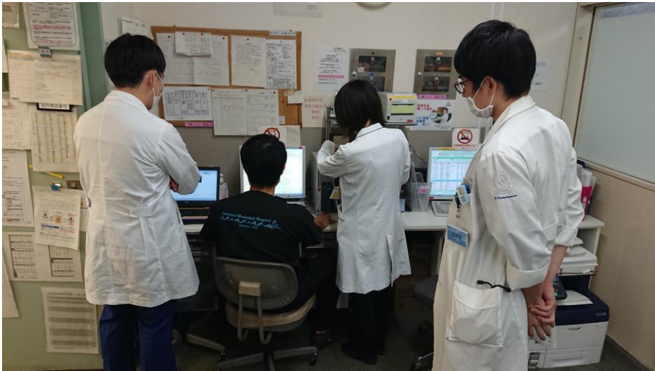
救急科カンファでディスカッション中の 病棟薬剤師（3年目）