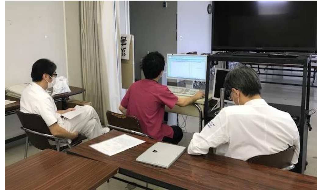
COVID-19サポートチームの写真 (医師3名と薬剤師1名で構成)