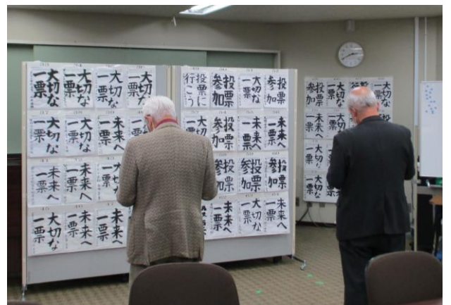
書道作品コンクール審査会の様子