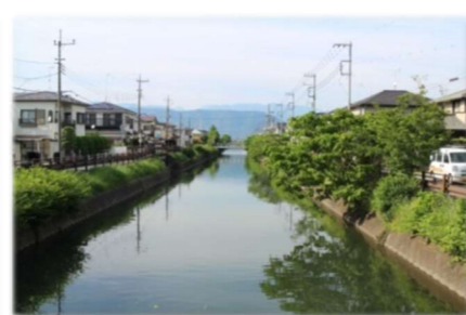
堀之内付近の仙了川のみどり