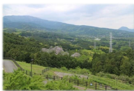
県立おだわら諏訪の原公園からの眺望