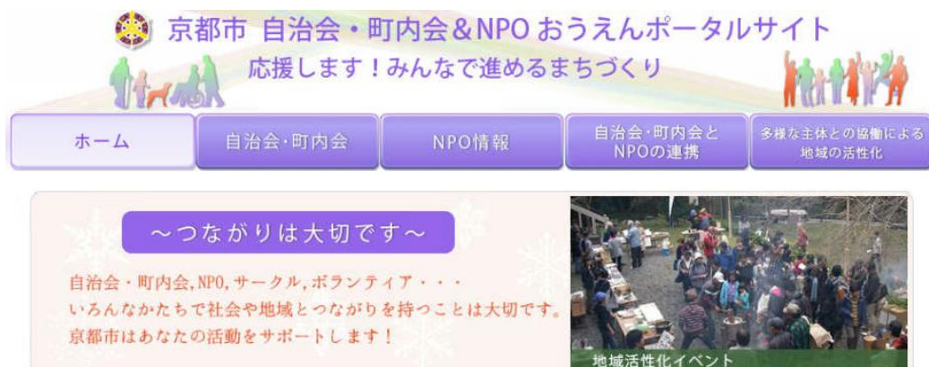
(視察先のホームページより引用)

ホームページ内の掲示板「出会いの広場」には、両者の協力してほしいことや協力できることを書き込むことができ、掲示した団体の活動が「地域団体とNPO法人の連携促進事業」に採択されるなど、一定の効果が生まれている。