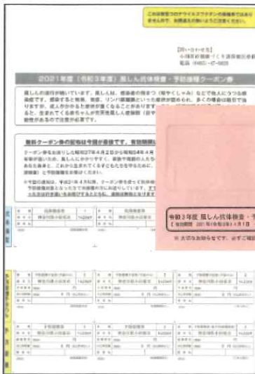
(ピンク色の封筒です)

令和4年度は、令和3年度にお送りしたクーポン券が引き続き使用できます。(使用期限は令和5年:2023年2月末までです。) 紛失された場合は再発行いたしますので、健康づくり課にお電話ください。