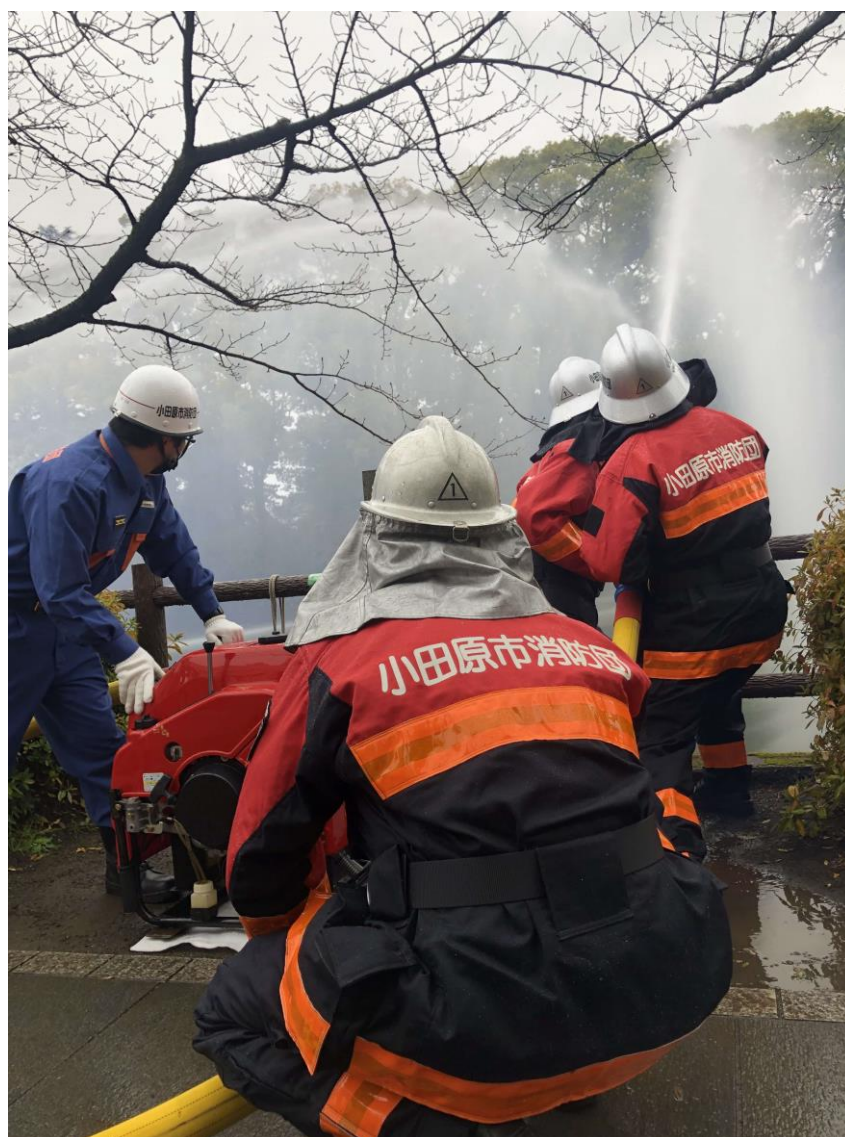
消防出初式一斉放水