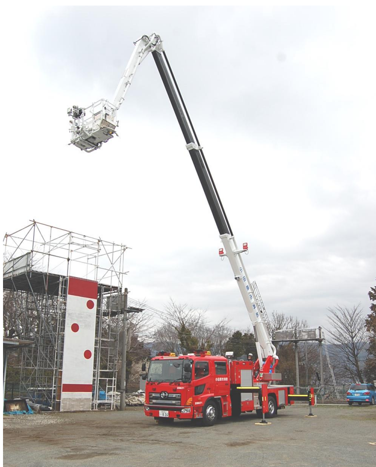
屈折はしご自動車（足柄梯子1）