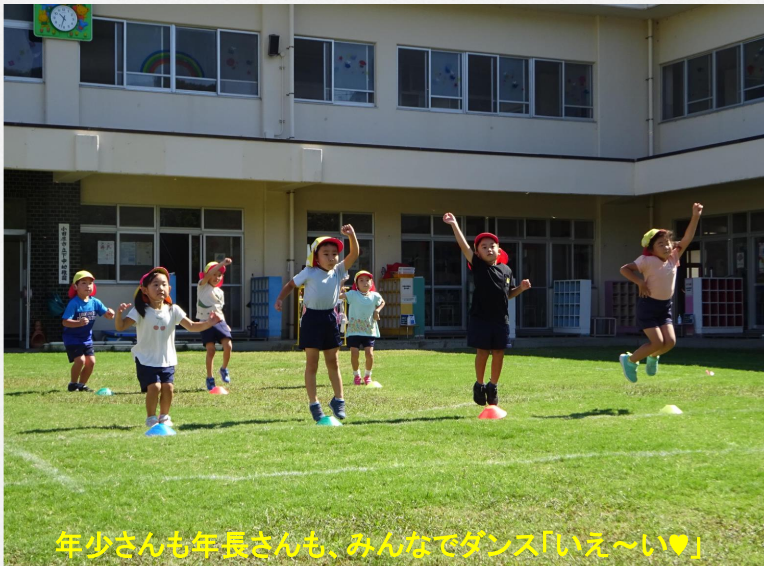
年少さんも年長さんも、みんなでダンス「いえ～い♡」