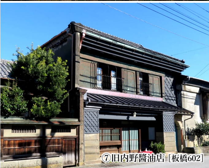
⑦旧内野醤油店 [板橋602]