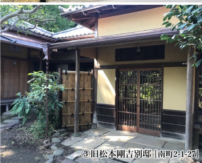
③旧松本剛吉別邸 [南町2-1-27]