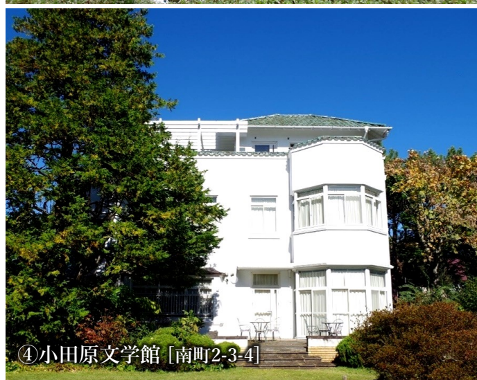
④小田原文学館 [南町2-3-4]