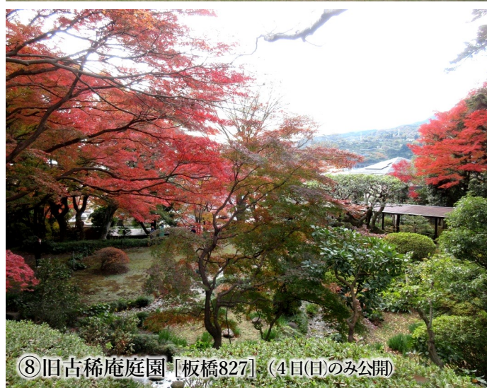
⑧旧古稀庵庭園 [板橋827] (4日(日)のみ公開)