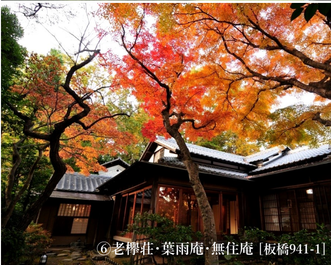
⑥老櫨荘・葉雨庵・無住庵 [板橋941-1]