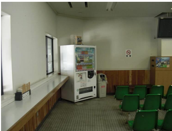
物件番号3 特別指定観覧席