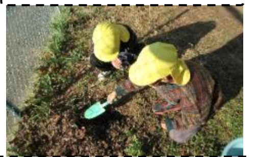
生き物の死から命の大切さを学びます。

冬場は虫を見掛けることもなく、子どもたちも氷づくりなど、季節に応じて自然物との関わりを深めていました。年長児が水の中に花びらを入れて氷をつくっているのを見て、年少児も早速、真似をして作り始めました。