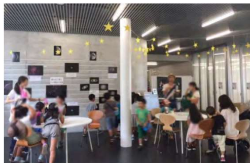
コミュニティ施設と複合した学校 流山市 おおたかの森センター