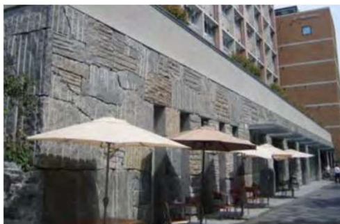
中学校、幼稚園などの教育・子育て機能を上階に、カフェやレストランなどの商業施設を1階に配置した複合施設 京都市立京都御池中学校

支援級の教室と通常級の教室を一続きの空間にできるようにし、座ってくつろいだり遊んだりできるスペースを設け、それぞれの学級の子供たちが交流しながら自由に過ごすことができる。