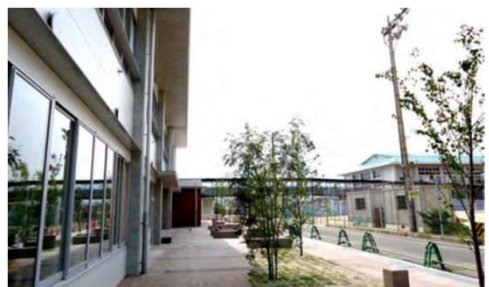
地域に開かれた「縁側通り」 廿日市市立大野西小・大野中学校