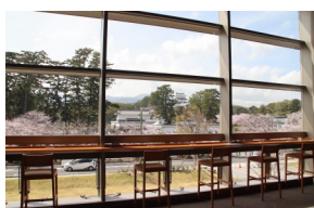
大ホールホワイエ

観劇の幕間などに休憩できる2Fのスペース「ホワイエ」を、ホールの利用がない日に開放しています。小田原城を望むことができるほか、Wi-fi、コンセントも完備でなにかと便利。(開放日はホールのホームページで公開中!)