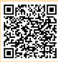
イベント特設ページ