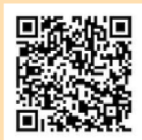
グッピーヘルスケア ダウンロード用

スマートフォンアプリ「グッピーヘルスケア」を ダウンロードして小田原市の健幸ポイント事業へ 参加して歩くだけ。