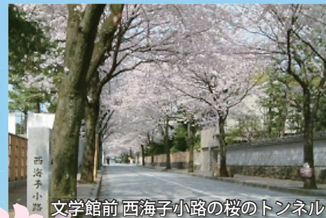
文学館前 西海子小路の桜のトンネル