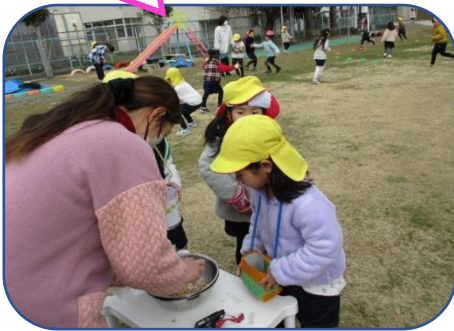
豆がなくなりました。 入れてください。