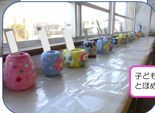
子どもたちは友達の作品を見て“すご〜い” とほめ合う微笑ましい姿がありました。