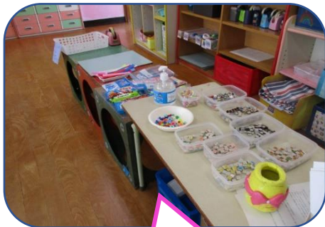
装飾品も豊富に準備して おきました。