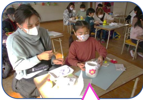
レースを準備して つけました!

1日(木)は年長組の保育参観・参加がありました。親子で“世界で一つしかないペン立てづくり”をしました。事前に親子で相談して設計図をかいてもらい、必要な材料(装飾したいもの)を当日までに準備してもらいました。当日は、楽しそうに共同作業していただき、各々が様々な工夫がされた素敵なペン立てができました。帰りの集まりでの振り返りでは、「難しかったけど楽しかった。」「完成が楽しみ!」という声が上がりました。ご協力ありがとうございました。