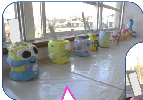
設計図通りにできた ようです!