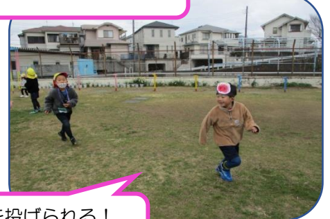
豆を投げられる！ 逃げるぞー！！