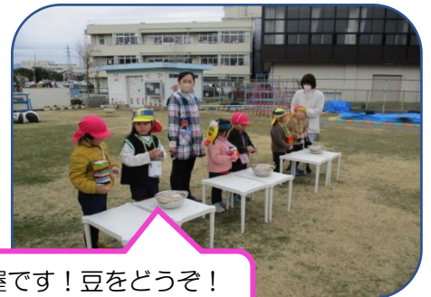
豆屋です！豆をどうぞ！