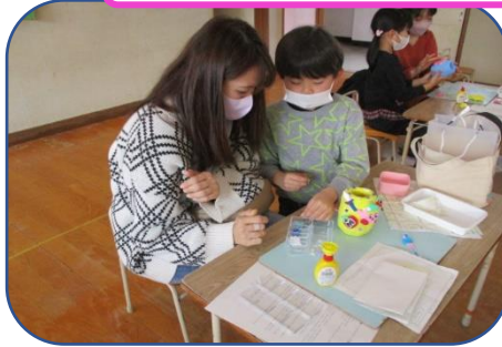
ボンドが難しいけど、楽しい!