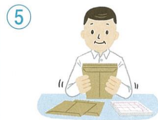
調査票の整理と提出