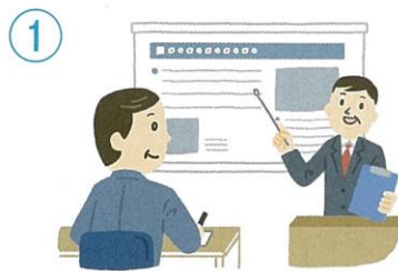
調査員説明会に参加