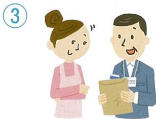
調査についての説明と調査書類の配布