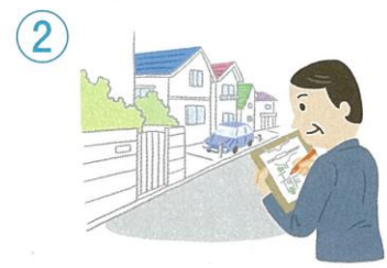
担当する地域の確認