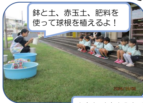
鉢と土、赤玉土、肥料を使って球根を植えるよ！

5日（火）チューリップの球根植えをしました。第1学期に経験した“ひまわり・ハツカダイコンの栽培”の第3回目。今回も自分の鉢にチューリップの球根を植えました。好みの色の花が咲く球根を選び、赤玉土、培養土（肥料も少々）、球根の順に入れていきました。「来年の春にはきれいな花が咲くね！」と言いながら大切に育てていきたいと思っています。