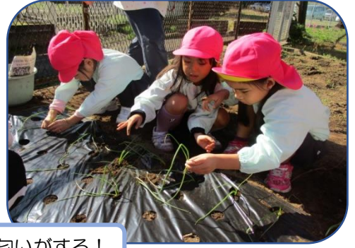
タマネギの匂いがする!