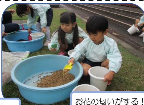
お花の匂いがする！