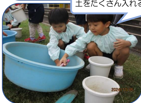
土をたくさん入れるよ！