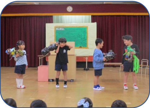
注文が入りました。 材料を準備しよう！