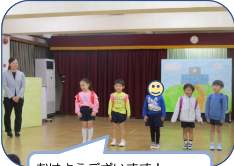
おはようございます！ 元気よく登校してきました！

14日(木)年長組の“子ども同士見る会”がありました。年長児は、これまで物語をみんなで考え、必要な物をつくり、表現することを積み重ねてきました。今日は、お家の人が見に来てくれる前の予行練習。ドキドキ・ソワソワ・ワクワクした様子でした。一方“やはぎっ子げんきっ会パート3”ってなあに？お家の人が見にくるの？と疑問符がたくさんついてる年少さんはお客さんとして、年長さんの発表を見せてもらいました。お互いにより刺激となり、年長児は4日後の本番に向けてさらに頑張っ取り組んだり、年少さんは、これまで以上に劇遊びが楽しめたりしそうです。