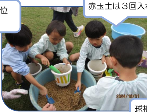
赤玉土は3回入れるよ！