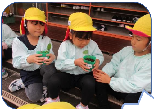
どんな匂いがする?