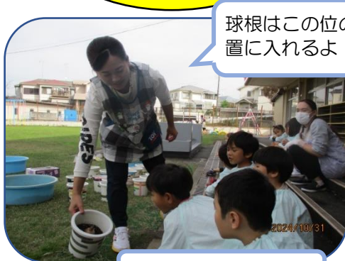
球根はこの位の位置に入れるよ

10月31日（木）一人一鉢スイセンの苗を植えました。植物に対して愛着や責任をもって世話をしてもらいたいと思い、自分で選んだ球根を植えました。りす組テラスで栽培します。来年の卒園の頃まで水やりや観察をしながら大切に育てていきたいと思っています。