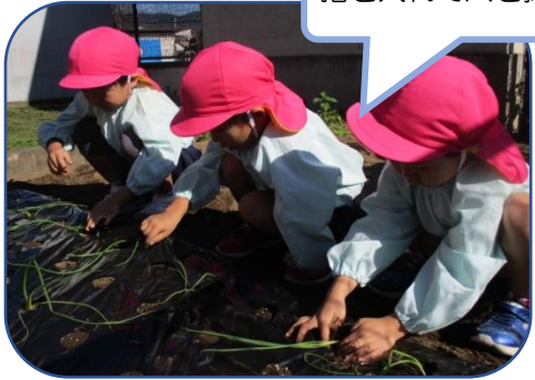
指を入れて穴を掘るよ!