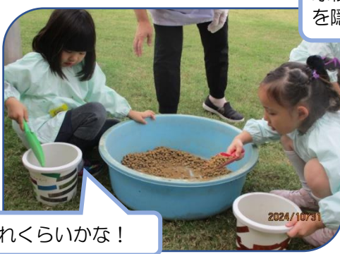
球根を入れて！土のお布団を隠れる位まで入れて！