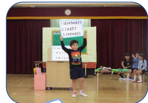
捕まえた虫のクイズを出します！