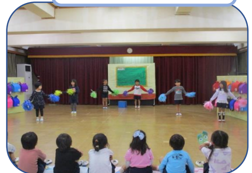
年長さんかっこいいな～