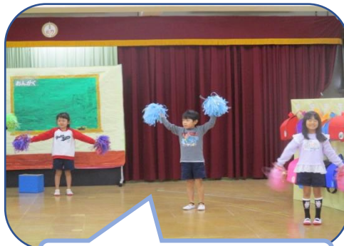
大好きなリズム音楽で踊ります！