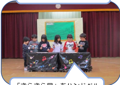
「きらきら星」をハンドベル で演奏します！