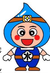
小田原市上下水道局キャラクター 「おみずまる」

新しく入れ替える水道管は、大地震の揺れに対しても、管の継手部が伸縮+屈曲して、漏水の原因となる離脱(抜け)を防ぎます。