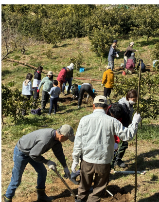
未来へつなぐ 早川みかん農園プロジェクト