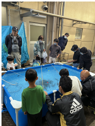
曾我っ子 ニジマス釣り体験