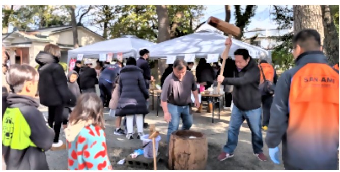
山王青年会地域交流イベント