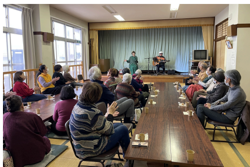
みんなで集う前羽カフェ