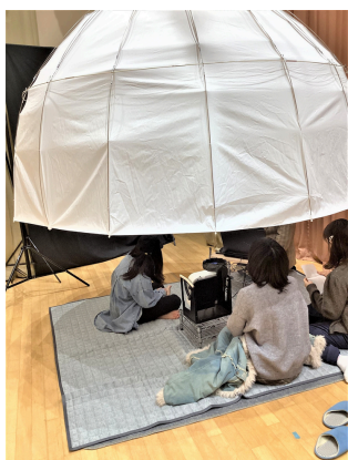
親子でドームプラネタリウム (国府津地区)