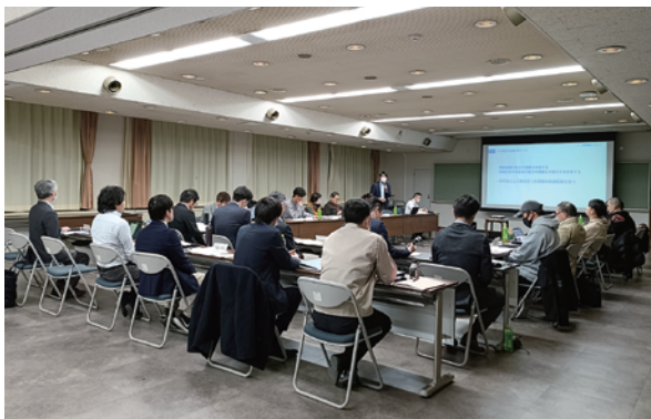
〈第1回研究会の様子〉