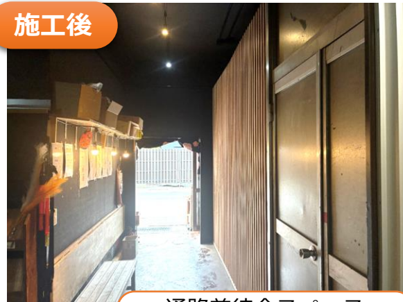
通路兼待合スペース