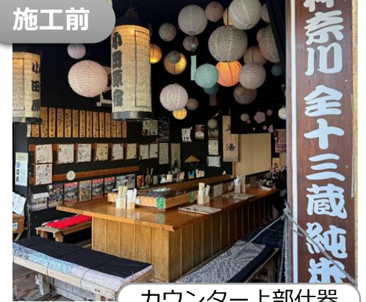
カウンター上部什器