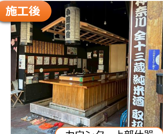
カウンター上部什器