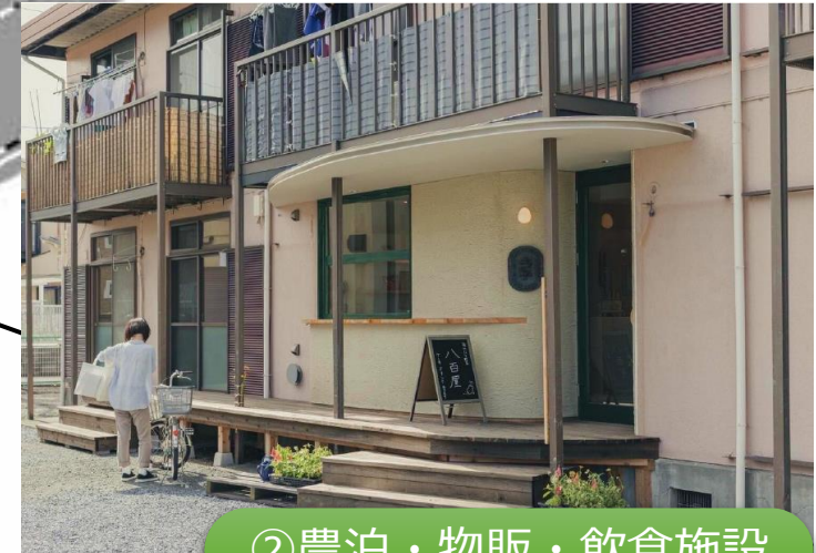
②農泊・物販・飲食施設