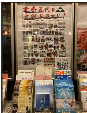
【神奈川県東京事務所】