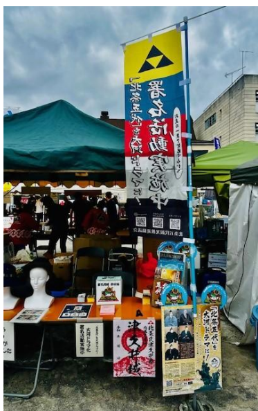
【津久井やまびこ祭り】