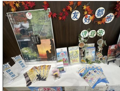
【伊豆市 平塚市役所の魅力展】