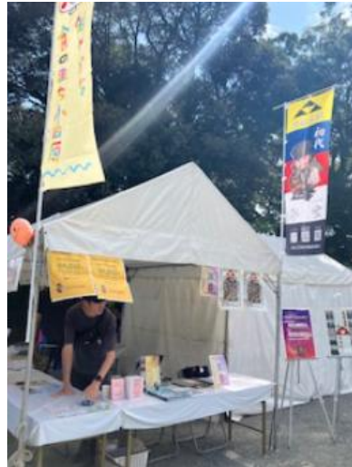
【水曜どうでしょうキャラバン】 【ローカルフードマルシェ】