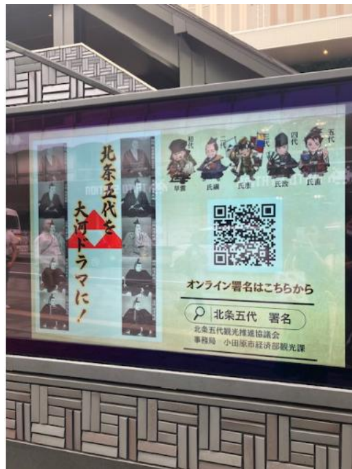
【デジタルサイネージ】