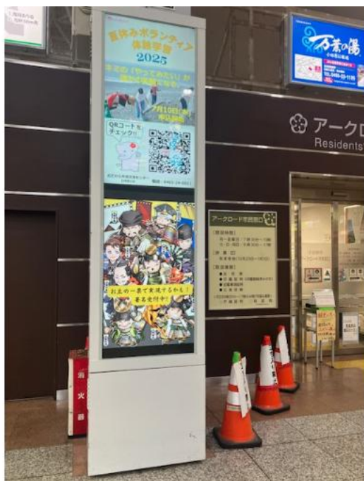
【デジタルサイネージ】