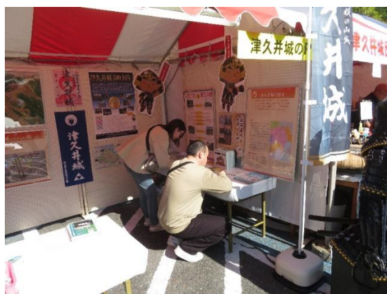
【八王子いちょう祭り】