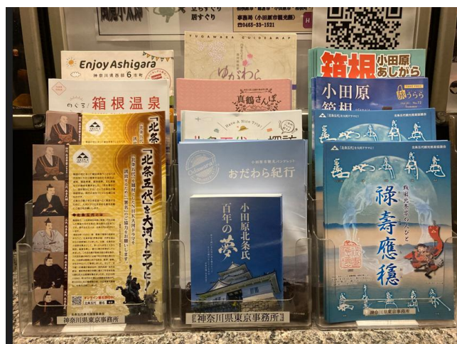
【神奈川県東京事務所】