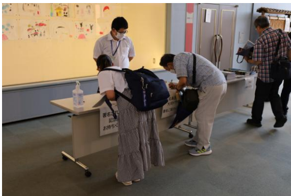
【沼津市 長浜城跡講演会】