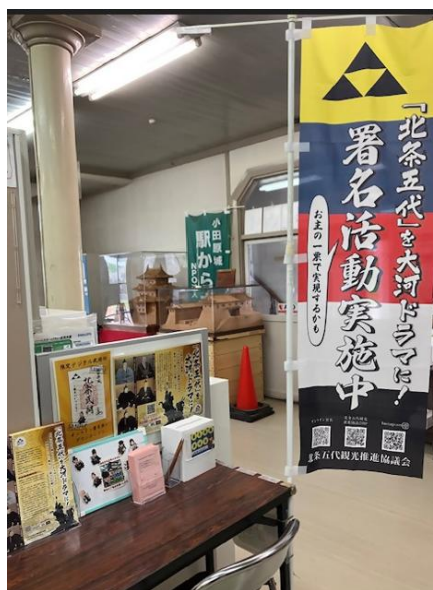
【小田原城二の丸観光案内所】