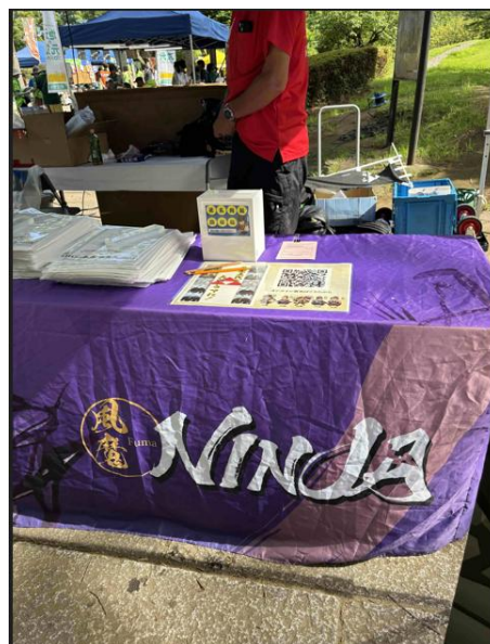
【ベルマーレホームタウンデー】