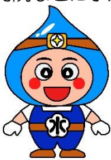
小田原市上下水道局キャラクター「おみずまる」

新しく入れ替える水道管は、柔軟性に優れ、継手部が抜けず(一体化)に、大地震の揺れや地盤沈下に対しても、破損や漏水を防ぎます。